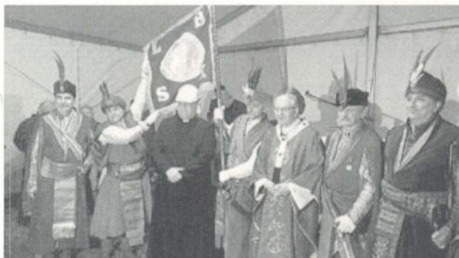
Fot. z poświęcenia placu pod budowę kościoła św. Jana Kantego

Po ośmiu latach spędzonych w Miechowie, w 1429, powrócił do Krakowa, gdzie objął wykłady