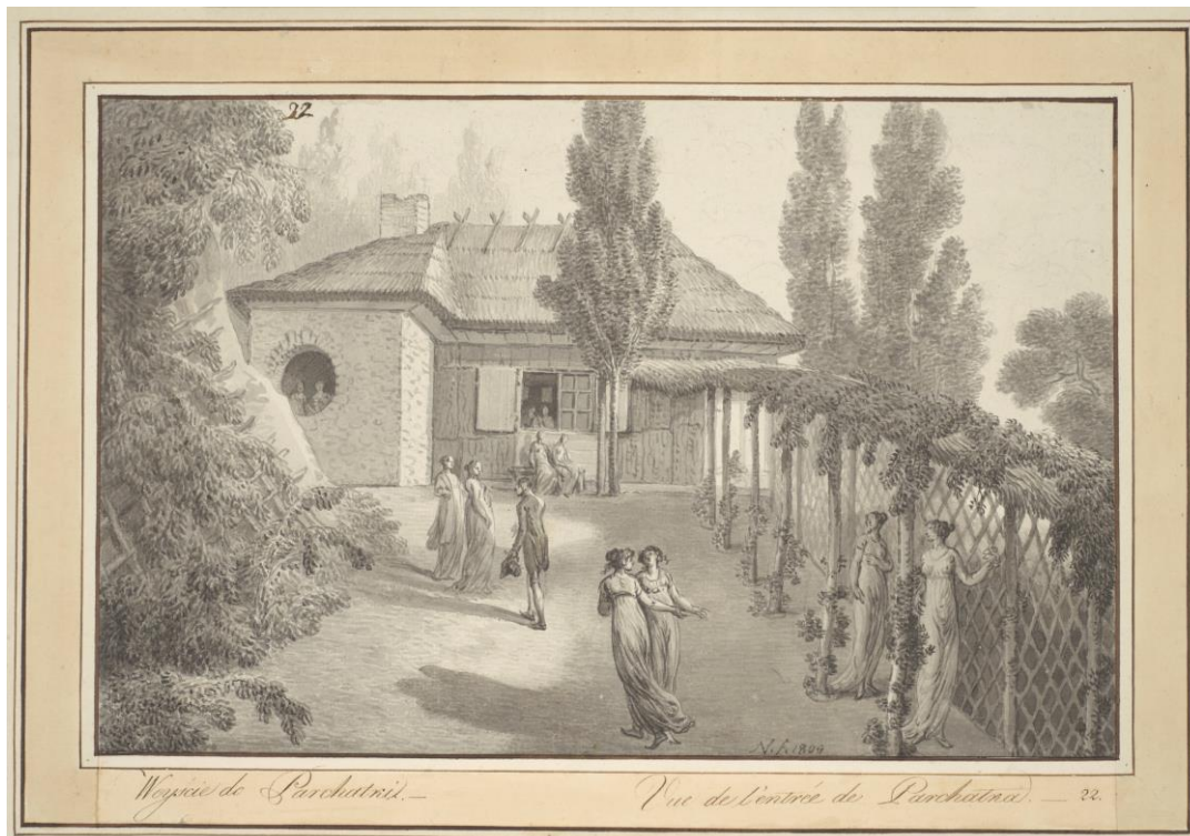
J.P. Norblin, Wejście do Parchatki , akwarela lawowana, zbiory Muzeum Narodowego w Krakowie, inw. MNK XV-Rr-7.

Mając na uwadze miejsce znaleziska na stoku wąwozu w ogrodzie krajobrazowym założonym przez księżną Izabelę z Flemingów Czartoryską można domniemywać, iż są to relikty kafli, z których mógł być postawiony piec ogrzewający sentymentalną chatkę prowadzącą do niego, co utrwalił na akwareli Jan Piotr Norblin w 1804 roku. Murowany komin widoczny na dachu chatki wskazuje na jakiś piec ogrzewczy, nie kuchenny.